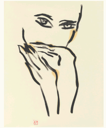
The Day That I Saw You (2016), Tekening Olie op papier, 63 x 48 cm