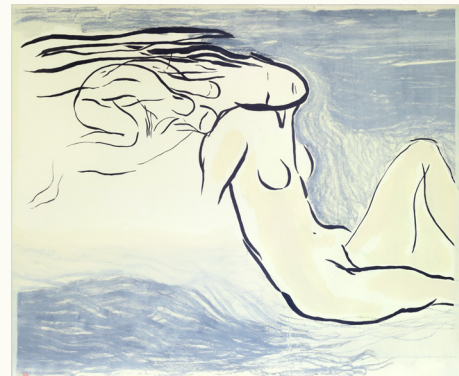
The Night (2016), Tekening inkt op papier, 170 x 185 cm

die richting doen. Confidenties van een kunstenaar. Ik schilder en teken door elkaar heen. Met verf komt er meer gelaagdheid. Bij tekeningen moet je met een paar lijnen de essentie zien te raken.”