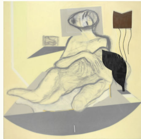
Pietà (2010), Waxwerk, 150 x 150 cm