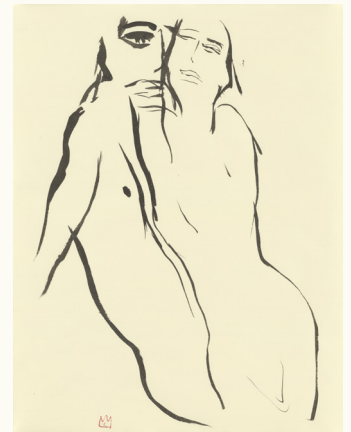
The Eye, (2010), tekening inkt op papier, 70 x 50 cm