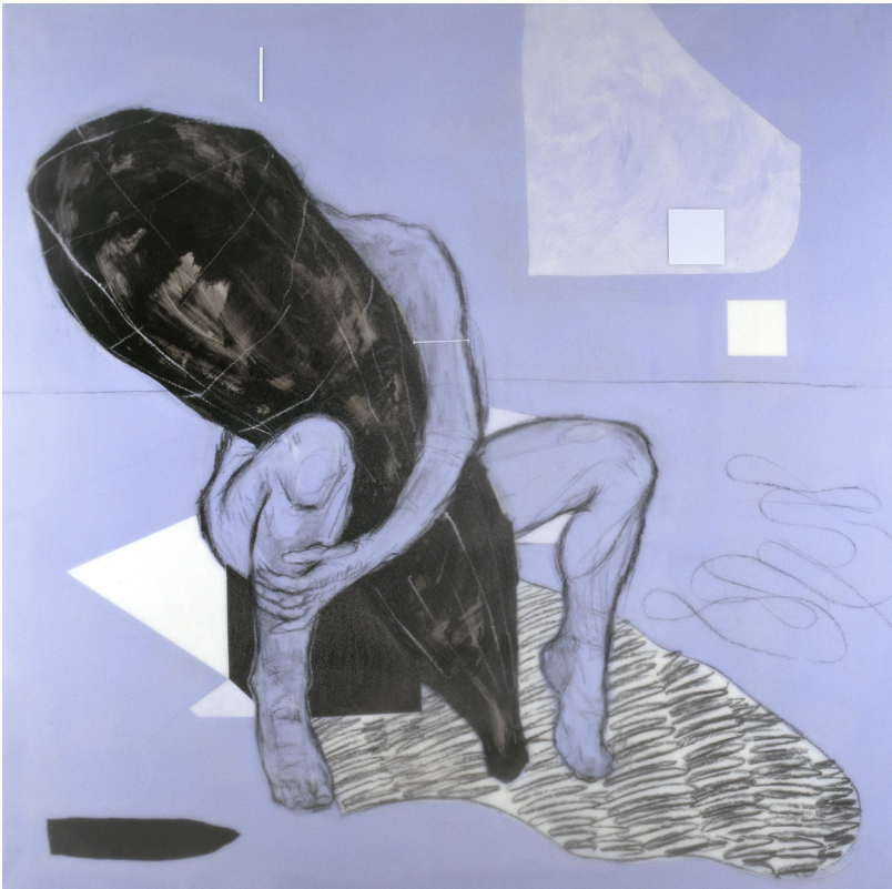
Beyond Reality (2007), Schilderij gemengde techniek, 150 x 150 cm